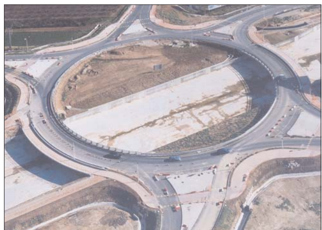
Vista de l'amplia rotonda construïda en alt sobre el Barranc amb accessos a Benifaió, Almussafes i Sollana